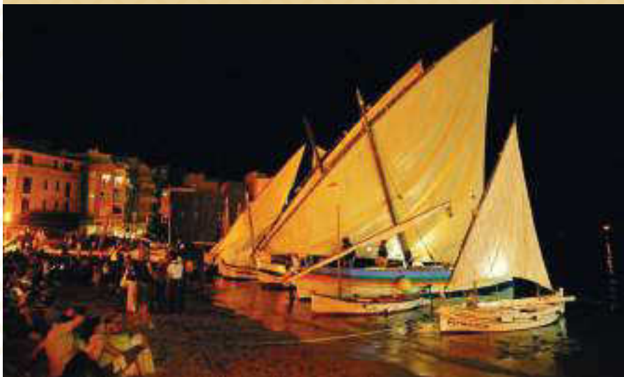
◀ La nit s'il·lumina a l'Escala durant la Festa de la Sal on, entre altres coses, es pot gaudir de la reunió d'embarcacions de vela llatina.

La Festa de la Sal és fruit de la voluntat i esforç de vora 300 voluntaris i una trentena d'entitats del teixit associatiu de l'Escala, fet que impulsa el municipi a treballar per aconseguir que la festa obtingui la distinció de Bona Pràctica de Salvaguarda del Patrimoni Immaterial de la Unesco. Aquest any se celebrarà el dissabte 17 de setembre.