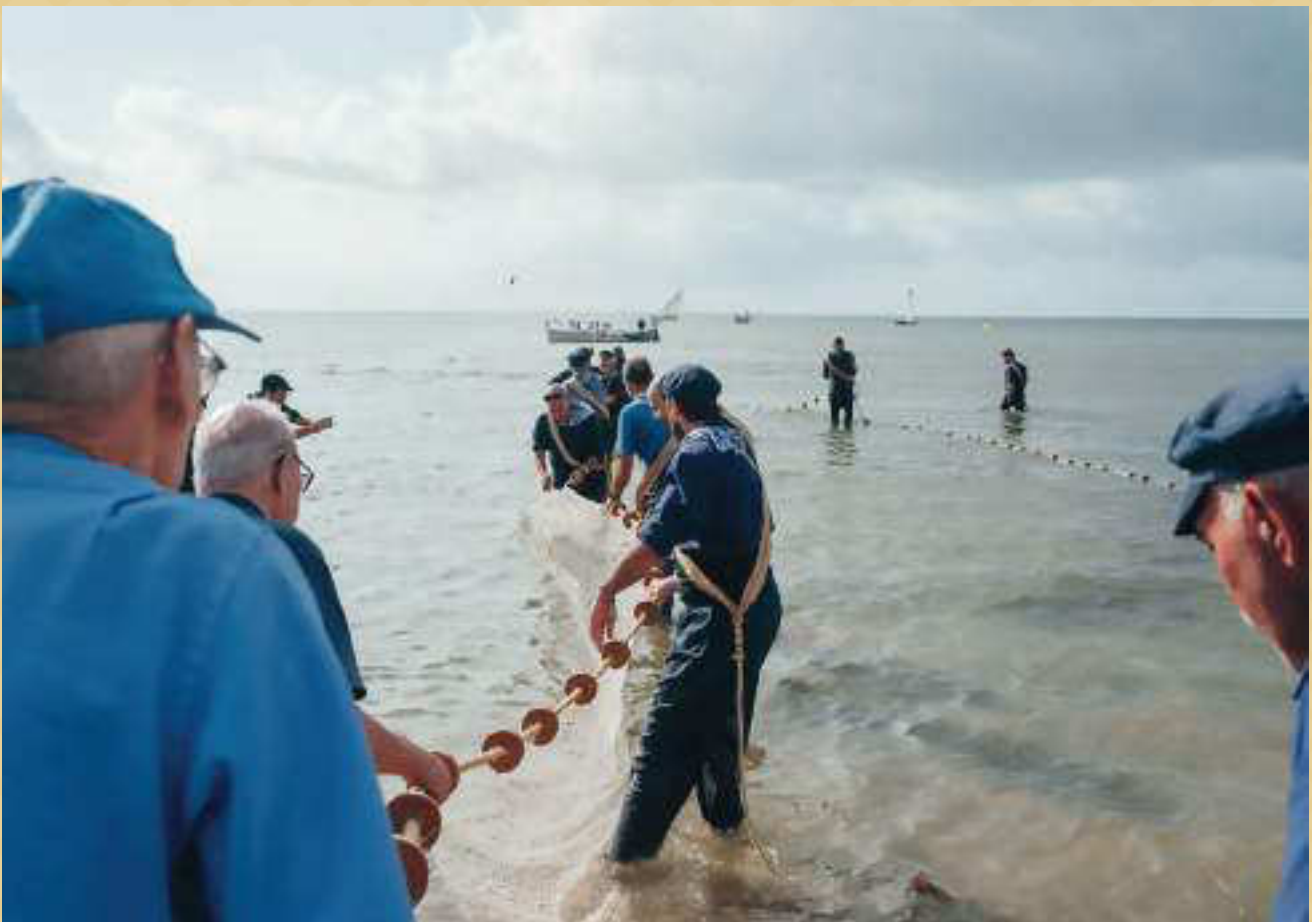
▲ Calada del rosegall a la platja de Garbí del port de la Ràpita.

perdut població i hi havia moltes cases i pisos en venda que ara ja han estat adquirits o reconvertits en pisos turístics. L'essència del barri, però no s'ha perdut i any rere any, a principis de tardor, la Ràpita torna als seus orígens gràcies a la implicació dels seus habitants. Orígens té una forta base en les associacions culturals, esportives i comercials locals, que ho tornaran a fer els propers 7 al 9 d'octubre. En certa manera, és una mostra que quan el poble treballa junt per un objectiu, les coses poden sortir bé. En un primer món cada cop més global i homogeni, cal recordar qui som i d'on venim com a comunitat.